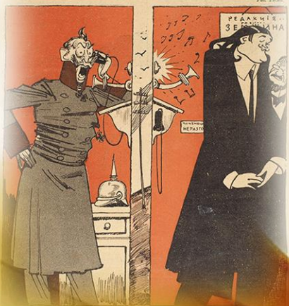
Журнал «Новый Сатирикон»

№ 34 ЕЖЕНЕДЕЛЬНОЕ ИЗДАНИЕ 1915 20 АВГУСТА