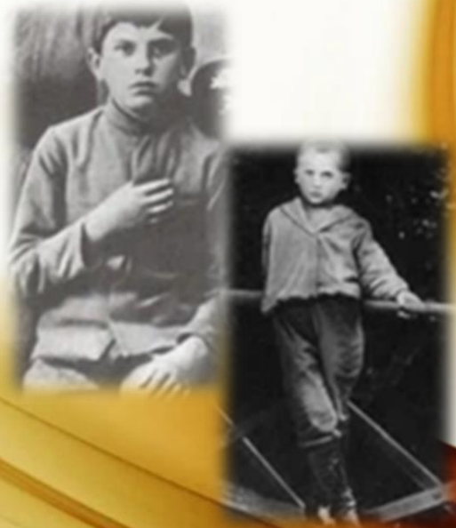
Владимир Маяковский в детстве