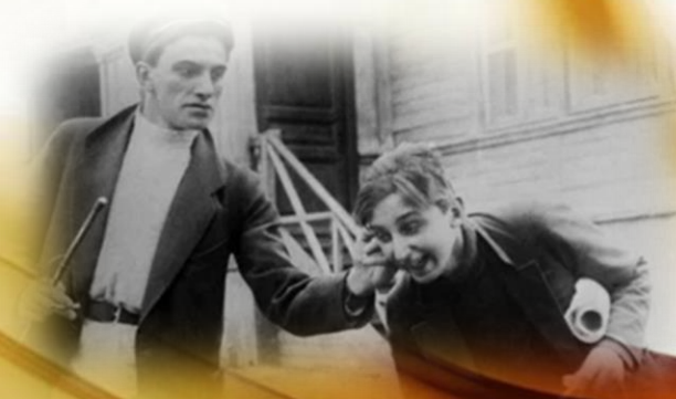
В. Маяковский в фильме «Барышня и хулиган»

то, что именно этот генерал совсем недавно награждал его медалью «За усердие». С 1917 по 1918 годы Маяковский выпускает несколько произведений, освещающих революцию – «Наш марш», «Ода революции». К первой годовщине Октябрьской революции поставили пьесу «Мистерия-буфф».