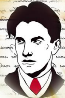
Выставка В. Маяковского «20 лет работы»

По мнению Мейерхольда, Маяковский был таким же гениальным, как Мольер, однако мнение критиков было абсолютно противоположным. «Клопа» они раскритиковали за художественные просчеты, а «Баню» разгромили в идейном плане.