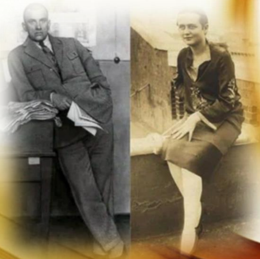
В. Маяковский и Элли Джонс

Это была какая-то маниакальная привязанность, но периодически в личной жизни поэта возникали и другие женщины, которые даже рожали от него. В 1920-м возлюбленной поэта стала Лилия Лавинская, от которой спустя год у него родился сын Глеб-Никита. Его не стало в 1986 году.