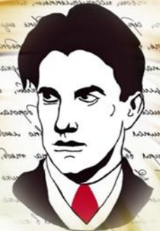
В. Маяковский с Лилей Брик

Вскоре между Маяковским и Лилей начались романтические отношения. Осип делал вид, что он не замечает этого романа. Поэт считал Лилю своей музой, это ей были посвящены самые трогательные его произведения. Безграничная любовь к этой женщине сквозила в стихах «Человек», «Флейта-позвоночник», «Лиличка!», «Ко всему».